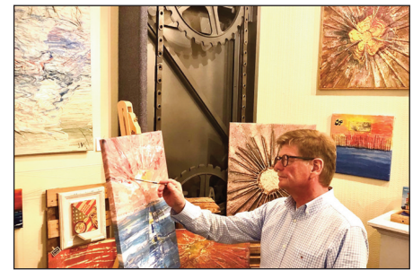
Hier im Weser ARTelier finden z.Zt. Zusammenkünfte des P.Art statt.

In vielen Orten auf dem Lande haben sich Künstler zusammengeschlossen, nach dem Motto „Gemeinsam sind wir stärker!“ So auch wir in Petershagen – handelt es sich hier um eine lose Organisationsform. In diesem lockeren Zusammenschluss arbeiten Maler, Schauspieler, Fotografen und Filmer, Bildhauer, Schriftsteller, Musikschaffende, aber auch Organisatoren von möglichen Veranstaltungsstätten, wie Mitglieder der Alten Schule Wietersheim daran, mehr Aufmerksamkeit sowohl beim Publikum als auch bei den offiziellen Behörden auf ihr Schaffen zu lenken.