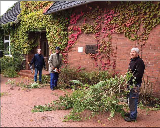
Arbeitskreis Wietersheim wieder sehr aktiv.