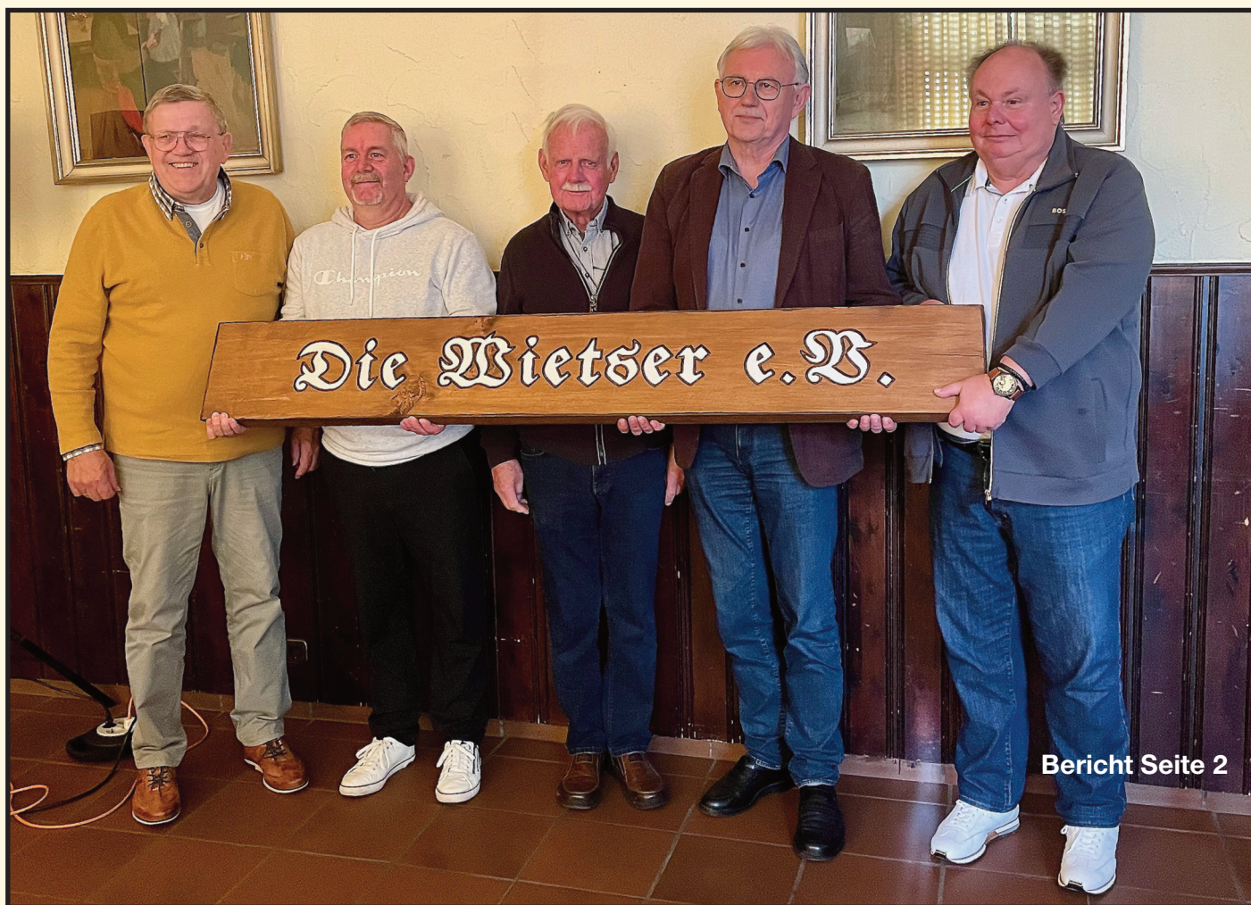
Bericht Seite 2

SPD nomiert neuen Bundestagsabgeordneten