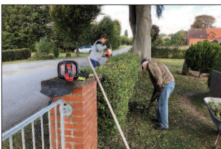
Arbeitskreis Wietersheim war wieder aktiv.