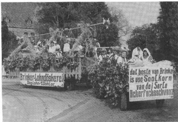
einer der 23 Erntewagen